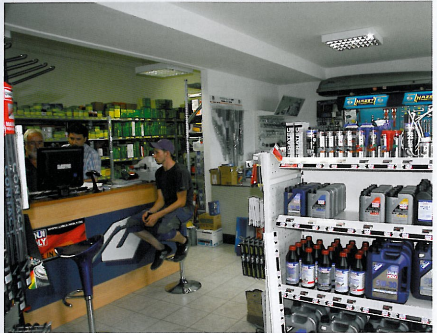
Dröschler in Jena: Eingemietet in das Auto Center Burgau bietet Dröschler in Jena Ersatzteile und Zubehör zum Verkauf an.

Als Mitglied der Einkaufsgenossenschaft ATEV, der Dröschler seit 2009 angeschlossen ist, profitiert der Autoteilehändler/