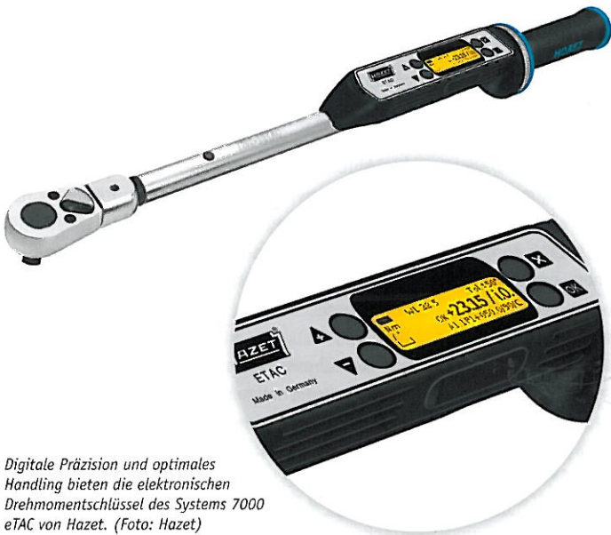
Digitale Präzision und optimales Handling bieten die elektronischen Drehmomentschlüssel des Systems 7000 eTAC von Hazet.

Das Menü lässt sich zum Schutz vor unbefugtem Verstellen mit einem Zahlencode sperren. Im Lieferumfang der Drehmomentschlüssel ist eine Einsteck-Umschaltknarre enthalten. Für andere Einsteckwerkzeuge ist die Wirklänge über das Display einstellbar.