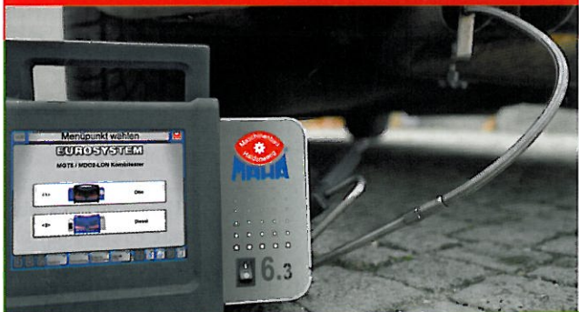
MET 6.3 Abgastester für Benzin- und Dieselfahrzeuge

Besuchen Sie uns vom 14. - 19.09. auf der automechanika FRANKFURT Halle 8.0 / A02, C04, A06, B06, C06