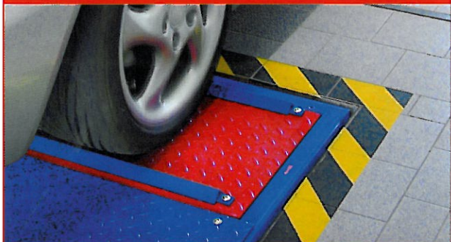
MSD 3000 Achsdämpfungsprüfstand