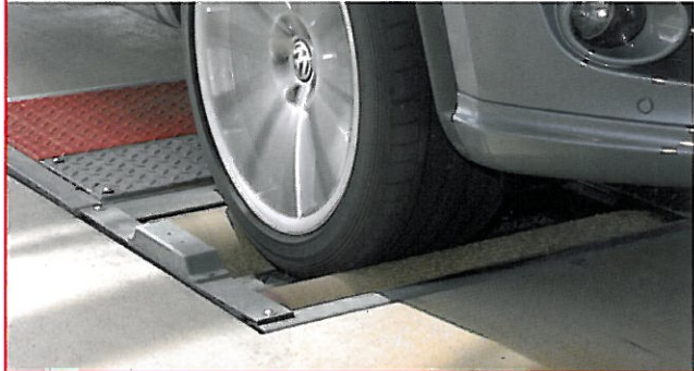
IW 2 LON EUROSYSTEM ALLRAD Rollen-Bremsprüfstand