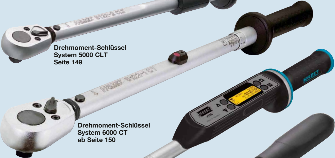
Drehmoment-Schlüssel System 6000 CT ab Seite 150