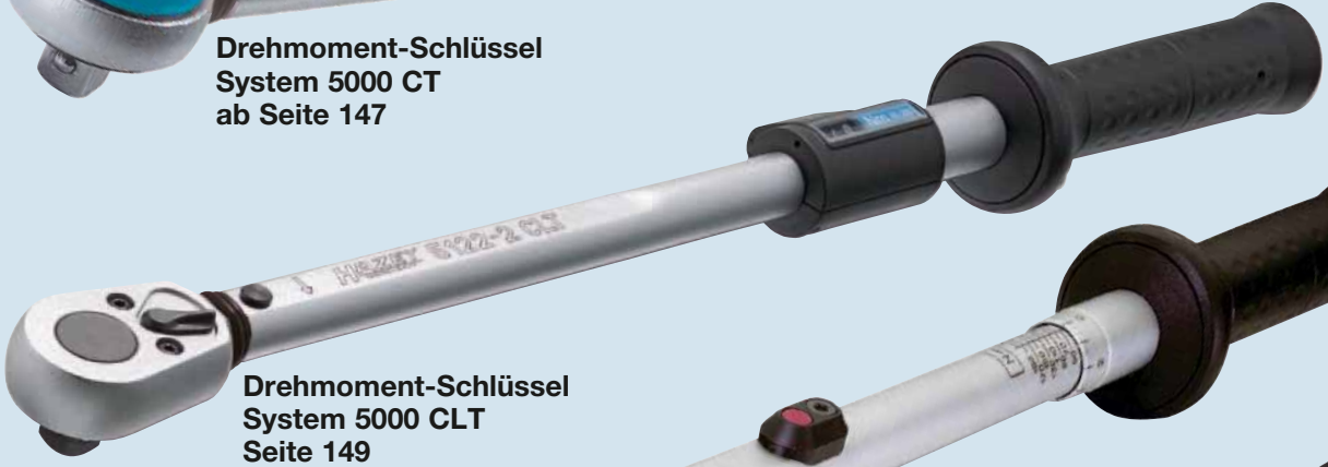
Drehmoment-Schlüssel System 5000 CLT Seite 149