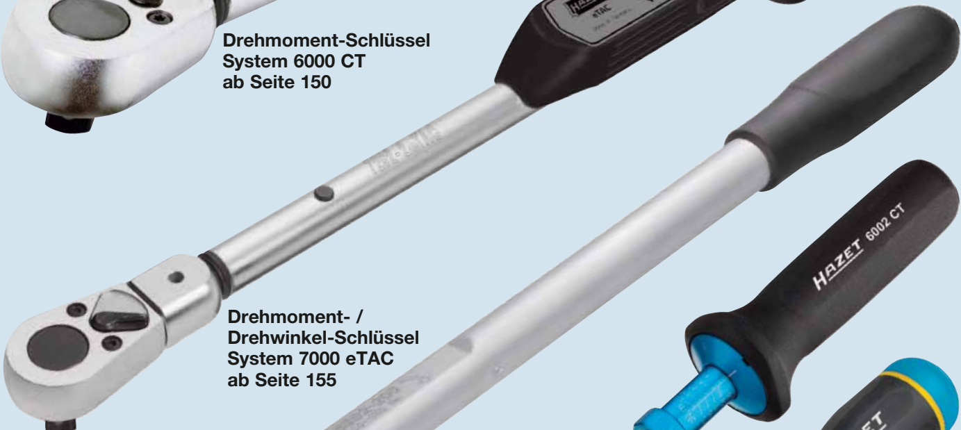
Drehmoment- / Drehwinkel-Schlüssel System 7000 eTAC ab Seite 155