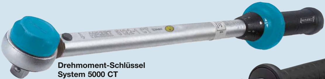
Drehmoment-Schlüssel System 5000 CT ab Seite 147