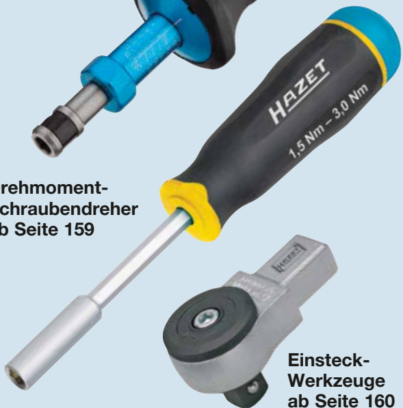
Einsteck- Werkzeuge ab Seite 160