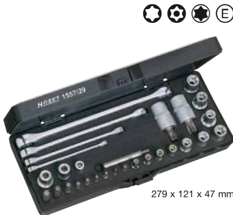
279 x 121 x 47 mm