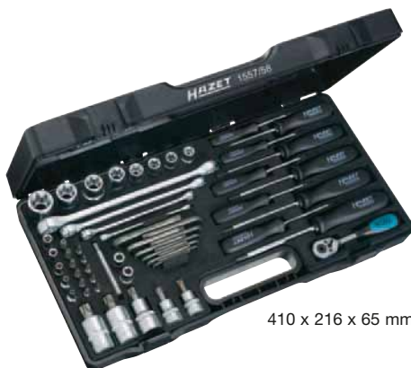
410 x 216 x 65 mm

Inhalt: 609-E 6 x E 8 E 10 x E 12 E 14 x E 18 E 20 x E 24 803-T 6 T 7 T 8 T 9 T 10 T 15 T 20 T 25 T 27 T 30 850-E 4 E 5 E 6 E 7 E 8 880-E 10 E 11 E 12 E 14 8802-T 40 T 45 900-E 16 E 18 E 20 E 24 992-T 50 T 55 T 60 2115-T 6 T 7 T 8 T 9 T 10 T 15 T 20 T 25 T 27 T 30 T 40 2223-T 6 2223-T 7 H T 8 H T 9 H T 10 H T 15 H T 20 H T 25 H T 27 H T 30 H T 40 H 2223 Lg-T 25 2250-1 2 2264