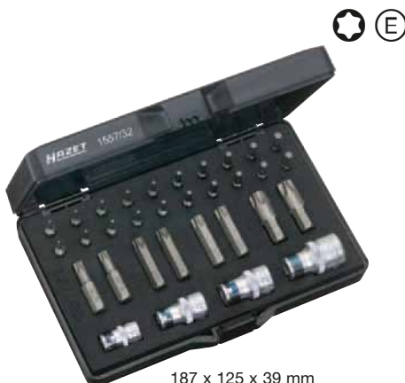
187 x 125 x 39 mm