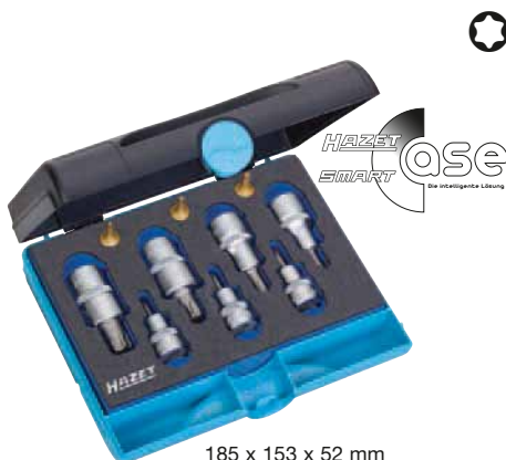
185 x 153 x 52 mm