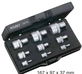
167 x 97 x 37 mm