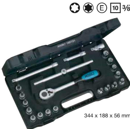
344 x 188 x 56 mm