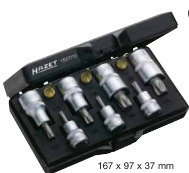
167 x 97 x 37 mm