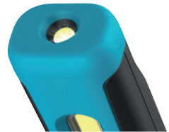
Top Licht / Top lamp