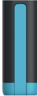
Halteclip / Clip