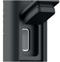
USB-C / USB-C