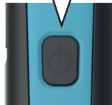
Stufenlos Dimmbar / continuously dimmable